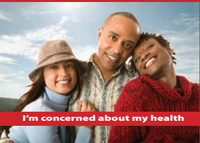
I'm concerned about my health