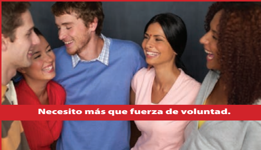
Necesito más que fuerza de voluntad.