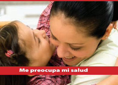
Me preocupa mi salud