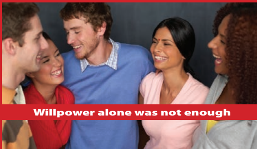
Willpower alone was not enough